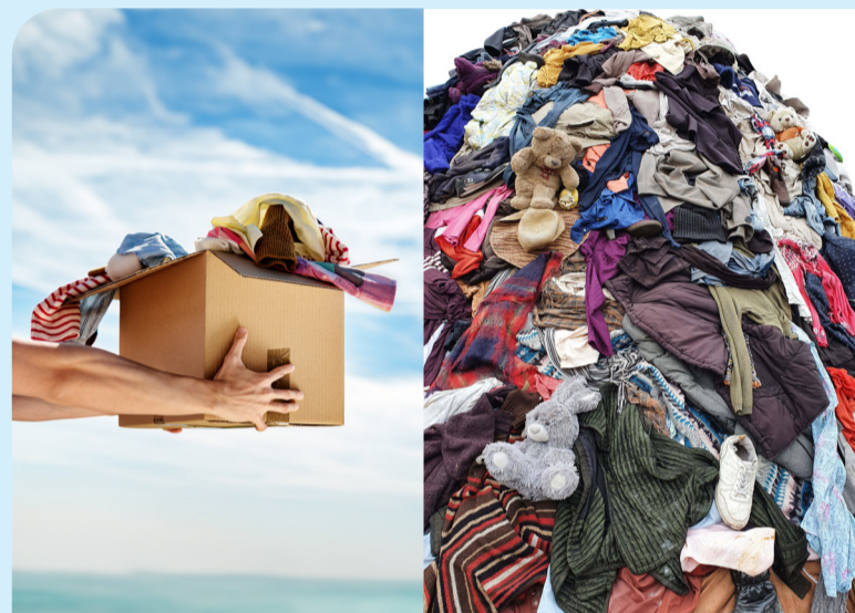
Odpověď: Podle údajů ministerstva životního prostředí Češi ročně vyhodí 120-180 tisíc tun textilu (11-19 kg na jednotlivce).