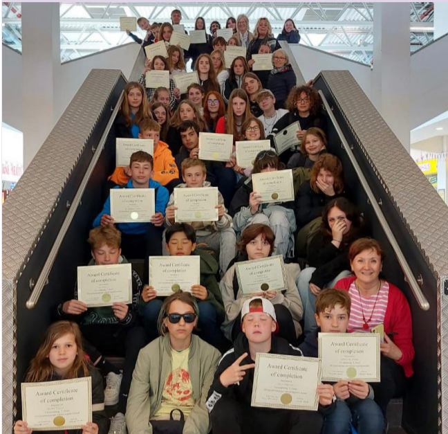
Žáci ze ZŠ Mariánka s jazykovými certifikáty

I v letošním roce bude Letiště Praha přispívat na jazykové pobyty dětí z okolních základních škol. Finanční dotace je do škol v blízkém okolí letiště distribuována prostřednictvím jazykových programů našich partnerů Městské části Praha 6, Městské části Praha 17-Řepy a Sdružení okolních obcí PAR – Prague Airport Region.