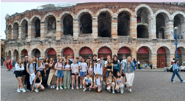
Poznávání historie země k učení jazyků patří. Římské památky obdivují žáci ze ZŠ Hanspalka